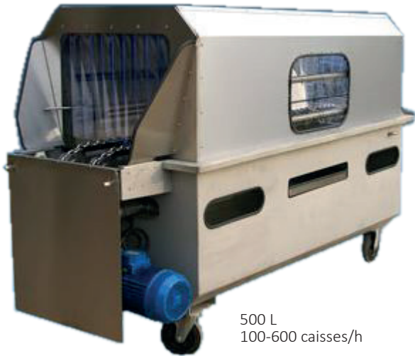
500 L 100-600 caisses/h