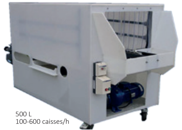
500 L 100-600 caisses/h

Gamme de laveuses de caisses, de palettes, lavage-séchage, groupe lavage-rinçage-séchage