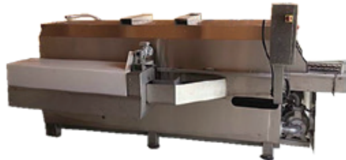
1300 L 100-1500 caisses/h