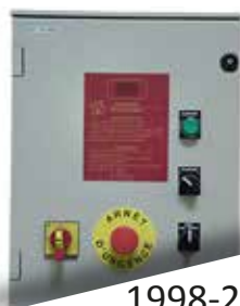
1998-2008 ACAI-S V1